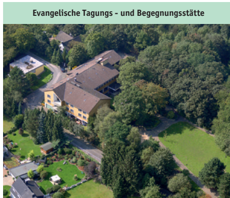
Evangelische Tagungs- und Begegnungsstätte

Haus am Turm, Am Turm 7, 45239 Essen Tel. 0201.40 40 67, www.hausamturm.de