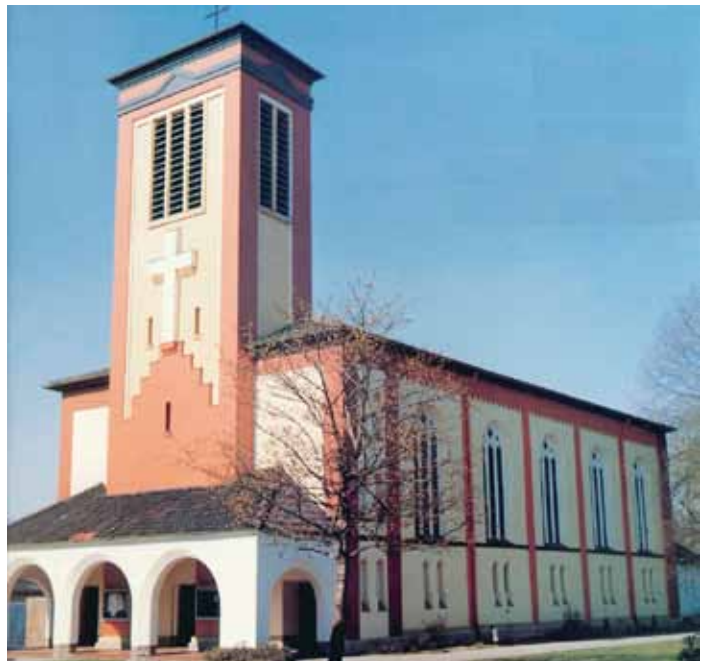
Die Matthäuskirche Bocholder Str. 39 45355 Essen