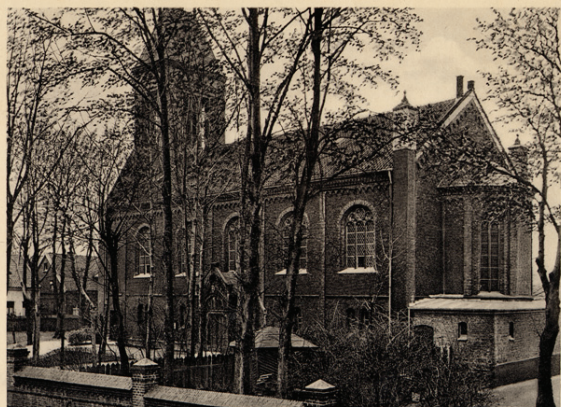
Eugl. Matthäus-Kirche zu Essen-Borbeck